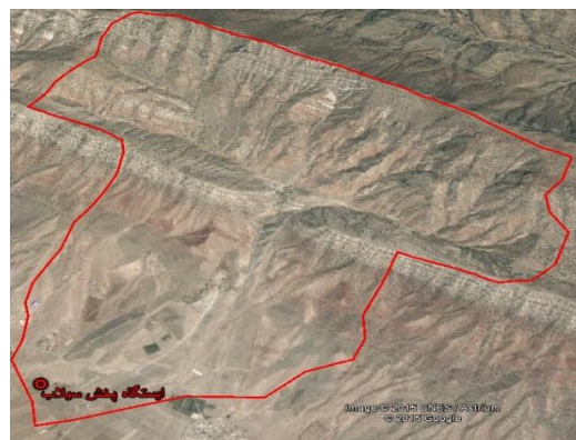
شکل (۱): موقعیت جغرافیایی منطقه مورد مطالعه

منطقه مورد مطالعه حوزه آبخیز داوود رشید با مختصات جغرافیایی ۳۳°۳۲' تا ۳۳°۳۵' ۳۹" عرض شمالی، در غرب استان لرستان واقع شده است. شکل (۱) موقعیت حوزه مذکور را در روی نقشه استان نشان می‌دهد. دشت کوه‌دشت یکی از قطب‌های مهم کشاورزی استان لرستان است که در پایین‌دست حوزه آبخیز داوود رشید قرار دارد. این منطقه از نظر تأمین آب مورد نیاز، کاملاً متکی به منابع آب زیرزمینی است و اقلیم مدیترانه‌ای با تابستان خشک و زمستان‌های مرطوب و متوسط بارندگی سالانه ۵۵۷/۴ میلی‌متر دارد.