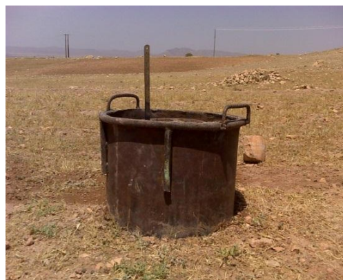
شکل (۲): استوانه‌های مضاعف نصب‌شده در محل تحقیق