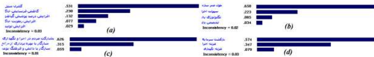
شکل (۵): وزن زیرمعیارهای چهار معیار a: اقتصادی، b: اکولوژیکی، c: اجتماعی، d: فنی