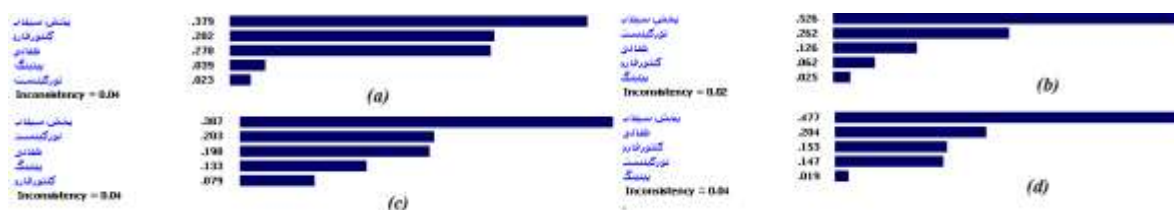
شکل (۴): وزن نسبی روش‌های ذخیرهٔ نزولات بر اساس معیارهای a: اقتصادی، b: اکولوژیکی، c: اجتماعی، d: فنی