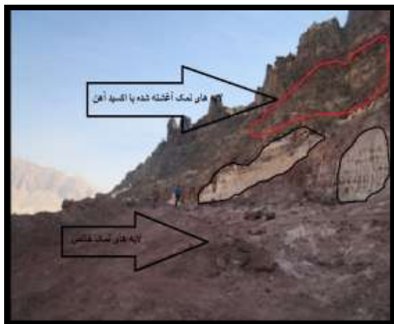
شکل (۲): نمایی از گنبد نمکی انگوران و بخش نمکی