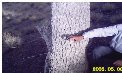
شکل (۳): استفاده از توری گایبونی جهت جلوگیری از تخریب بنه توسط تشی