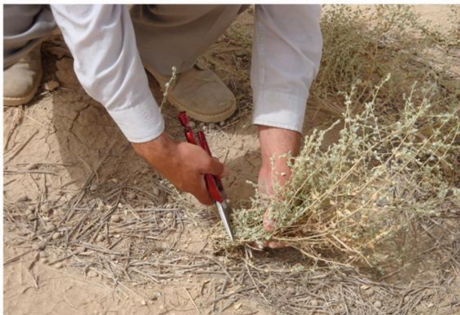
شکل (۱): برداشت اندام هوایی از گونه Atriplex leucoclada

کالیبراسیون NIR ابتدا با استفاده از برآورد درصد ADF (به‌وسیله دستگاه فایبرتیک) از طول موج‌های مختلف دستگاه NIR معادلات متعدد رگرسیونی برازش داده شد و براساس پارامترهای آماری از قبیل ضرایب همبستگی و اشتباه استاندارد بهترین معادله برای کالیبراسیون NIR انتخاب شد. در این روش اشتباه استاندارد کالیبراسیون و اشتباه استاندارد صحت برای درصد ADF به‌ترتیب برابر با ۲/۸۳ و ۲/۴۹ درصد به‌دست آمد که نشان‌دهنده ۲/۵ درصد خطای احتمالی دستگاه NIR در اندازه‌گیری درصد ADF است. جزئیات روش کالیبراسیون NIR توسط جعفری و همکاران (۲۰۰۳) و چاره‌ساز و همکاران (۲۰۱۰) توضیح داده شده است.