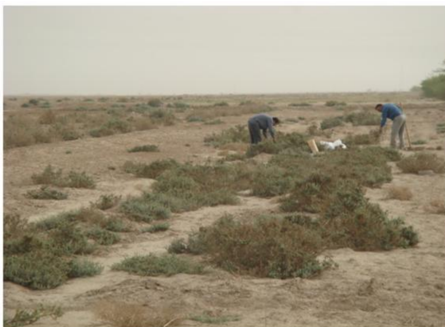
شکل (۲): برداشت اندام هوایی از گونه Suaeda vermiculata