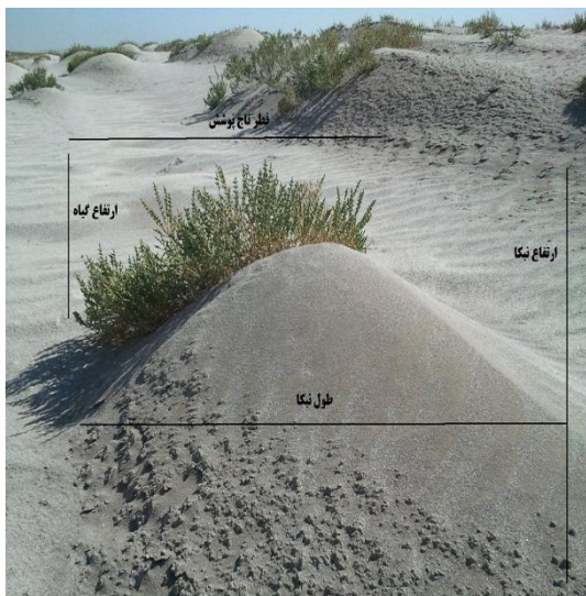
شکل (۲): نمایی از پارامترهای اندازه‌گیری شده روی نبکا