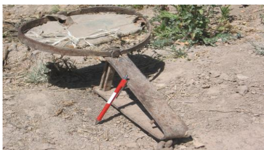
شکل (۴): نوعی تله سنتی برای به دام انداختن تشی