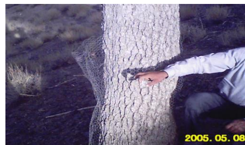
شکل (۳): استفاده از توری گایبونی جهت جلوگیری از تخریب بنه توسط تشی