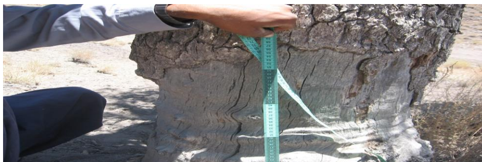
شکل (۱): نحوه اندازه گیری میزان خسارات پوست تنه درختان بنه

شدند. سپس به منظور بررسی اثر محیط تنه درختان بنه (به عنوان نماینده سن درخت) در انتخاب گونه توسط حیوان جونده (آیا سن یا محیط در ارتفاع برابر سینه درختان بنه در میزان کندن پوست توسط حیوان تأثیری دارد؟)، عملیات تجزیه واریانس در قالب طرح تصادفی در پنج تیمار محیط در ارتفاع برابر سینه ارزیابی شد. از آنجاکه تعیین سن دقیق درختان امکان پذیر نبود، از شاخص محیط تنه درختان در ارتفاعی برابر سینه، به عنوان نماینده سن درختان استفاده شد. همچنین برای خشی کردن اثر اندازه محیط به جای استفاده مستقیم آن، از شاخص نسبت قسمتی از طول تنه درختان که توسط حیوان گرفته شده است، به محیط برابر سینه درختان بنه استفاده گردید؛ یعنی اینکه نمونه ها از تقسیم طول قسمتی از تنه درخت که پوستش توسط تشی گرفته شده بود، به اندازه محیط در ارتفاع برابر سینه همان درخت به دست آمده اند بدین ترتیب ویژگی های فوق در پنج تیمار محیط برابر سینه کمتر از ۱۲۰، ۱۰۰-۱۰۰، ۱۳۰-۱۵۰، ۱۲-۱۳۰ و بزرگ تر از ۱۵۰ سانتی متر (که از این به بعد به طور خلاصه به ترتیب تحت عنوان تیمارهای ۱ تا ۵ آن ها را می شناسیم) با تعداد تکرارها به ترتیب ۱۱، ۱۰، ۱۰، ۹ و ۱۰ مورد ارزیابی و تجزیه و تحلیل قرار گرفتند. برای مقایسه بین میانگین ها در این تحقیق، از آزمون کمترین اختلاف معنی دار (LSD) استفاده شد. سپس به منظور بررسی اثر خشکسالی بر میزان تخریب درختان بنه، تغییرات میزان بارندگی سالانه نزدیک ترین ایستگاه به منطقه مورد مطالعه (بلورد از شهرستان سیرجان) از سال ۱۳۳۸ تا ۱۳۸۸ بررسی و ارزیابی شد.